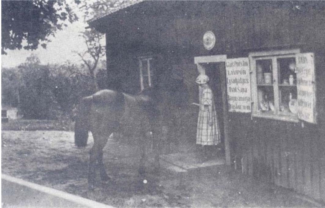
Davidsborg i slutet av 1800-talet. Det var då handelsbod.